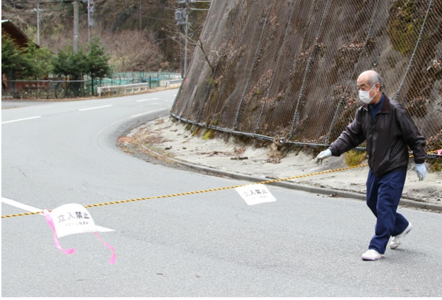
▲ドローン飛行の安全上、着陸地点半径 30m 以内に人が立ち入らないよう、規制線のロープを張る中津川区長