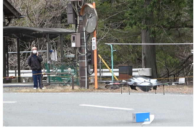
▲東京の遠隔運用者と、離陸地点スタッフの3者間通話で、着陸地点の状況確認に応じる中津川区長